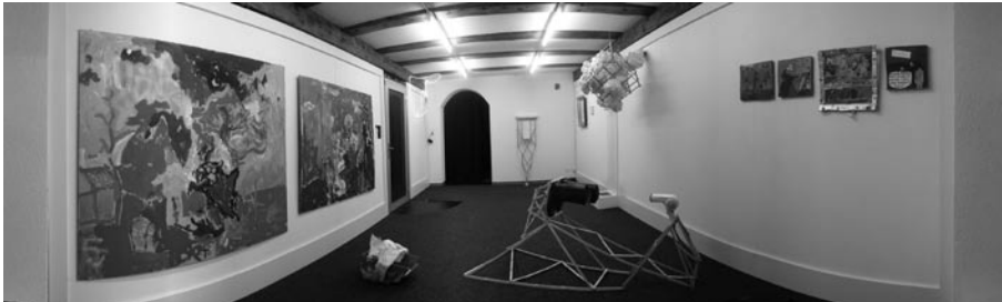
Ausstellungsansicht GRAF | CONRAD