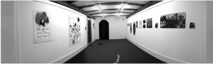
Ausstellungsansicht SPICHTIG | WILLIMANN