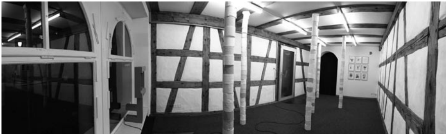
Ausstellungsansicht GERMANN | MARKE